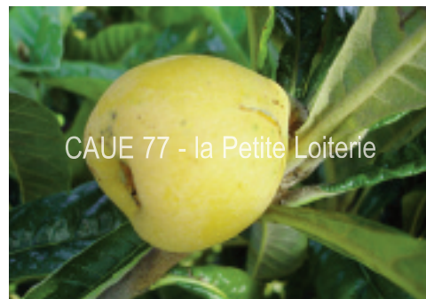
Bibasses (3 à 4 cm)