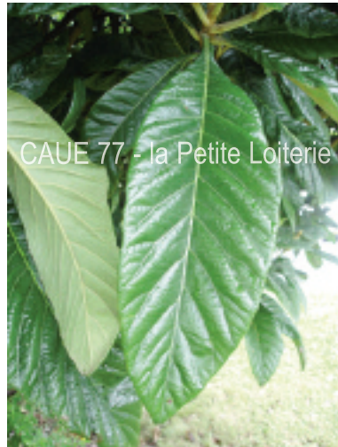
Feuilles coriaces (20 à 30 cm)