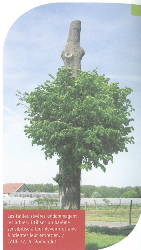
Les tailles sévères endommagent les arbres. Utiliser un barème sensibilise à leur devenir et aide à orienter leur entretien. / CAUE 77, A. Bonnardot.

L'évaluation préalable d'un aménagement offre au maître d'ouvrage une base de comparaison des arbres entre eux et un outil pour définir les principes de maintien ou de suppression des arbres existants. Un barème permet aussi de suivre l'évolution des arbres évalués dans le temps, défendre les budgets et orienter l'entretien. Les informations collectées peuvent aussi alimenter les actions de communication et de sensibilisation. ■