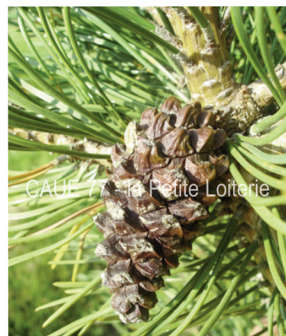
Cône fermé (4 à 5 cm)

Pinus mugo est un pin de petit développement, au port naturellement irrégulier. C'est un des rares pins sauvages européen de dimensions modestes, donc adapté à des espaces restreints.