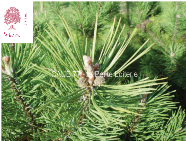
Aiguilles (3 à 5 cm)