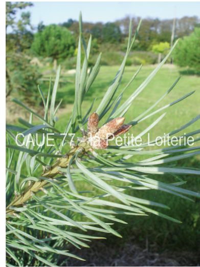
Aiguilles vrillées (4 à 7 cm)