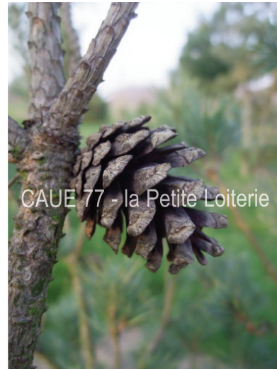
Cône (3 à 5 cm)