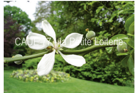
CAUE 77 - la Petite Loiterie