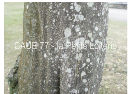
CAUE 77 - la Petite Loiterie