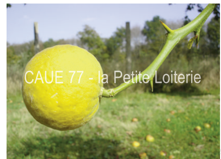
CAUE 77 - la Petite Loiterie