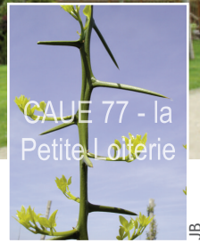
CAUE 77 - la Petite Loiterie