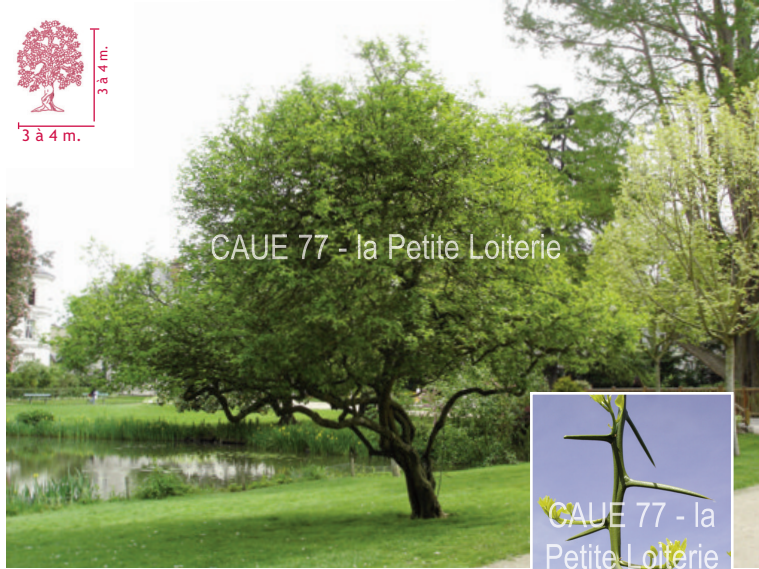
CAUE 77 - la Petite Loiterie