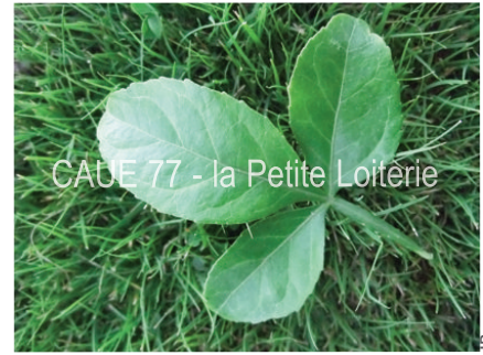
CAUE 77 - la Petite Loiterie