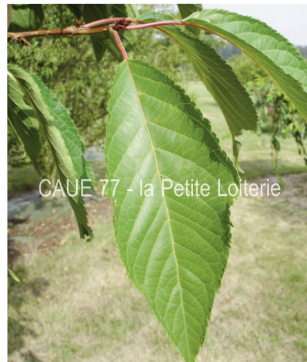
Feuille en été (6 à 12 cm)