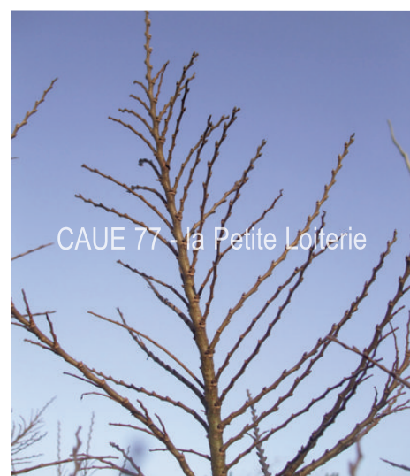
CAUE 77 - la Petite Loiterie