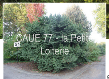
CAUE 77 - la Petite Loiterie

ulmus : du nom latin de cet arbre minor : 'plus petit' en latin