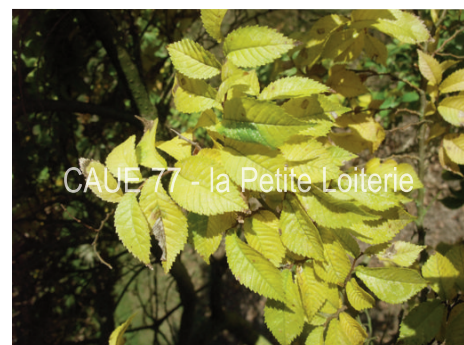
CAUE 77 - la Petite Loiterie