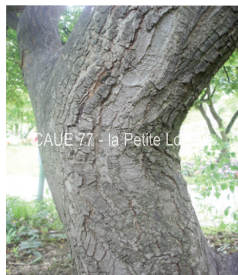
CAUE 77 - la Petite Loiterie