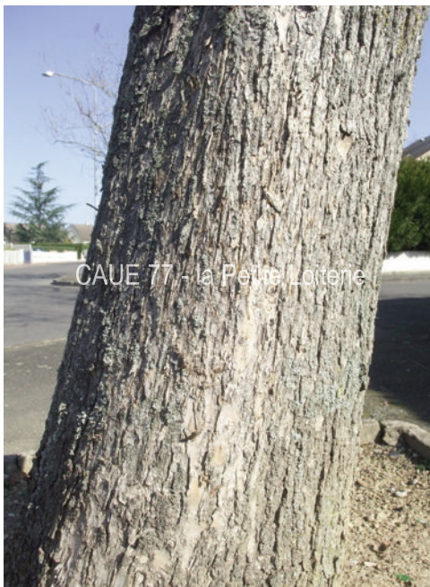
CAUE 77 - la Petite Loiterie