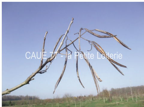
CAUE 77 - la Petite Loiterie