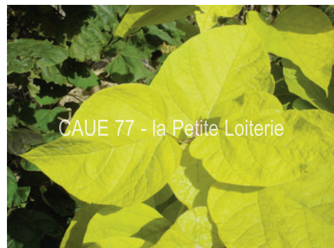
CAUE 77 - la Petite Loiterie