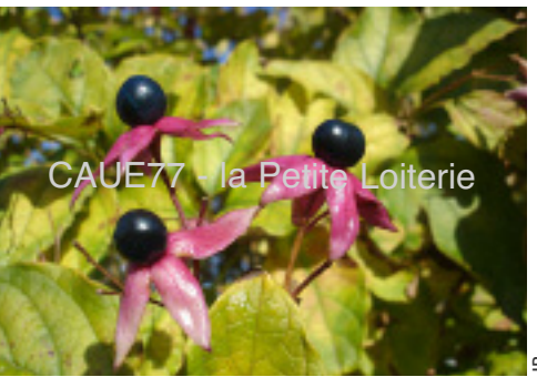
Baie bleue et calice rouge

Port : grand arbuste à port ovoïde. La forme en cépée lui convient bien. Il est possible de le former en tigitte (arbuste remonté sur petite tige) mais cette opération est difficile car il a un port naturel buissonnant. Rameaux : épais et duveteux. Ecorce : gris clair. Feuillage : feuilles de 10 à 15 cm de long, ovales, garnies de poils en bordure du limbe. Odeur forte de "beurre de cacahuète" lorsqu'on les froisse. De couleur vert foncé, elles deviennent jaune en automne. Floraison : en août-septembre apparaissent des fleurs blanches à calices rouges, groupées en panicules. Elles ont l'avantage d'être parfumées. Fructification : fruits très originaux et assez abondants en automne (octobre). La baie bleue, de la grosseur d'un pois, est entourée d'un calice rouge.