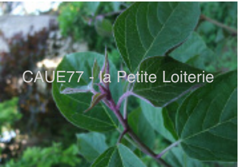
Feuillage au printemps (10 à 15 cm)