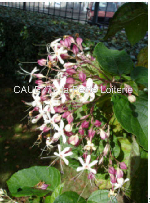
Fleurs groupées en panicules